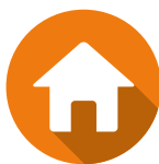
LES RESPONSABILITÉS CIVILES VIE PRIVÉE ET LOCATIVE