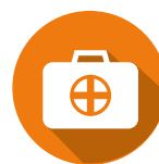
L'ASSISTANCE / RAPATRIEMENT