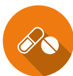
LES FRAIS MÉDICAUX