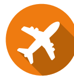
L'ASSURANCE PERTE ET VOL DE BAGAGES

Il ne vous reste plus qu'à choisir votre zone d'expatriation :